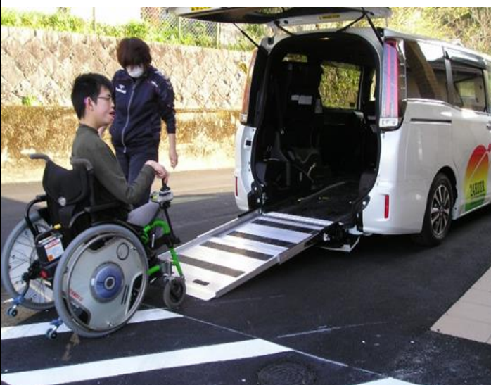
「行ってきます」平日は、日中活動系事業所等で過ごします。