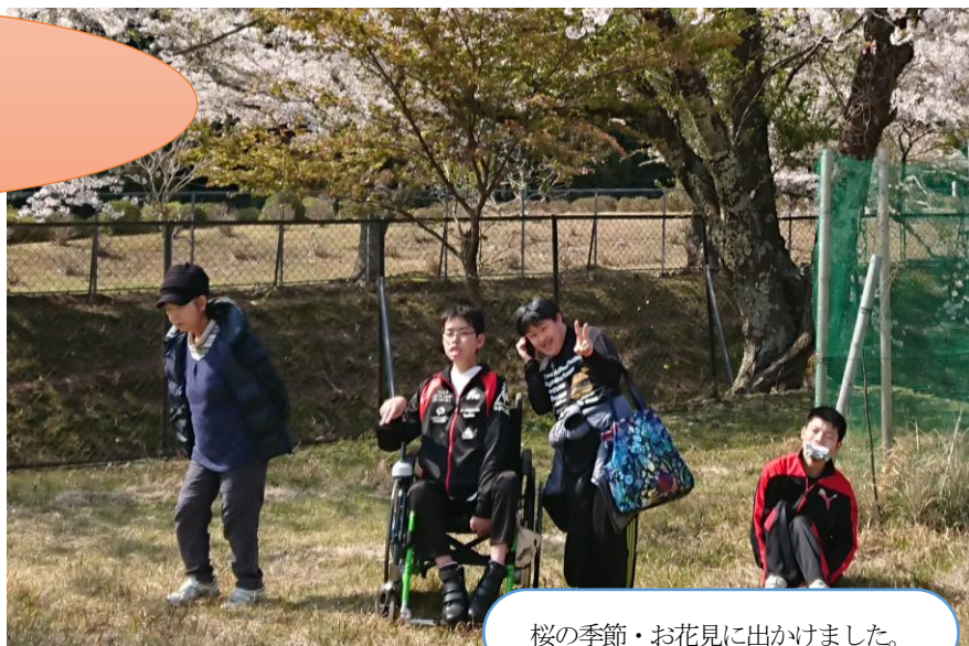
桜の季節・お花見に出かけました。