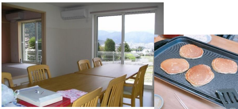
ゆったりした家庭のような食堂。・・・料理への参加と会話が弾む工夫も・・・