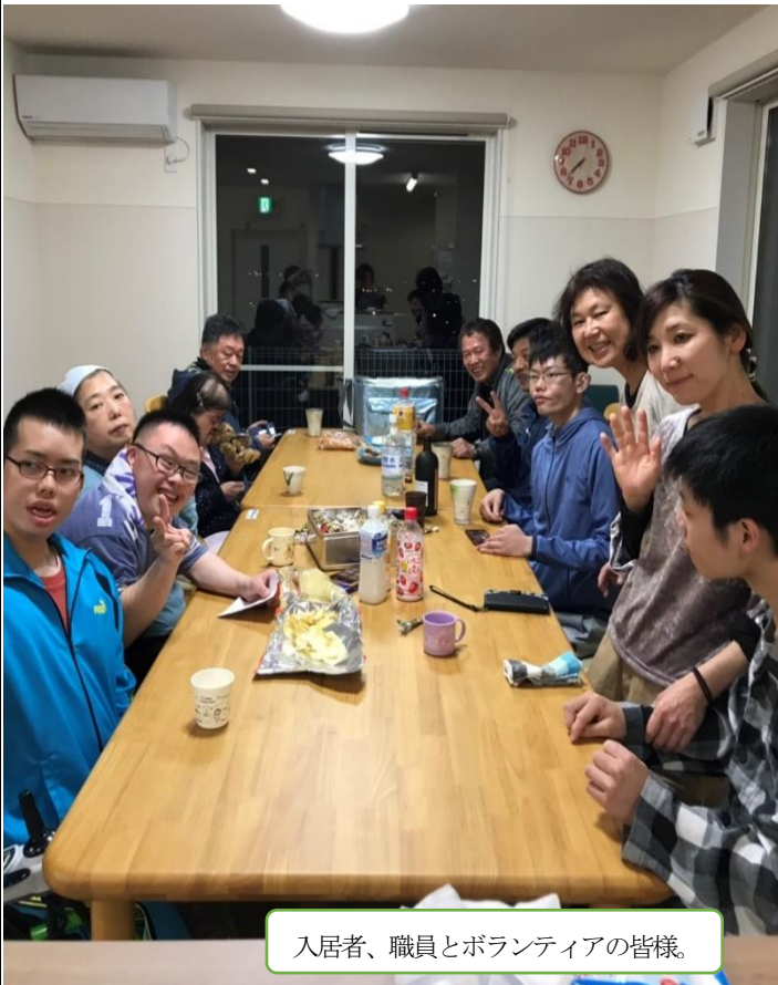
入居者、職員とボランティアの皆様。

2019年4月1日、「和家」(わや)の事業を開始することができました。今日までのご協力に深く感謝いたします。また、今後ともよろしくお願ひ申し上げます。スタートしたばかりの和家の生活の様子をお伝えします。