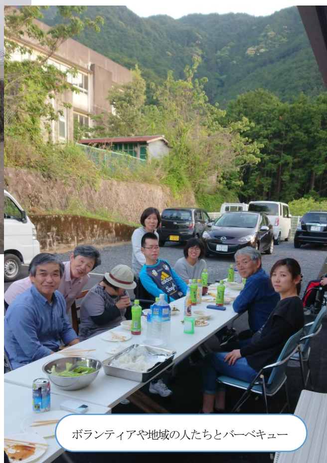
ボランティアや地域の人たちとバーベキュー