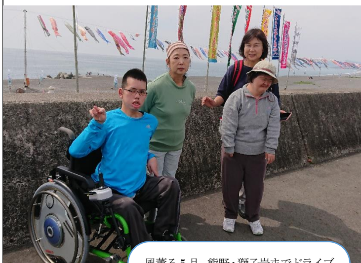
風薫る5月。熊野・獅子岩までドライブ