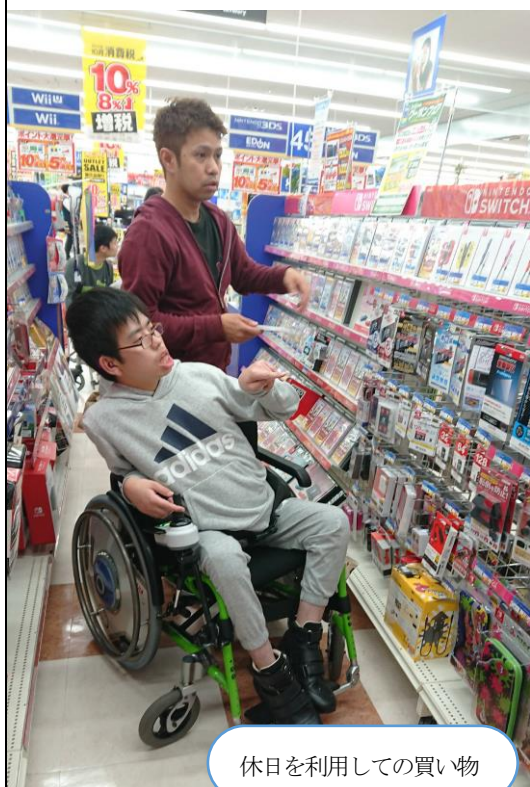
休日を利用しての買い物